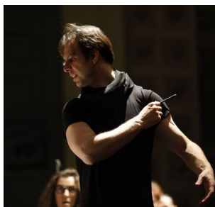
Currentzis © astridackermann