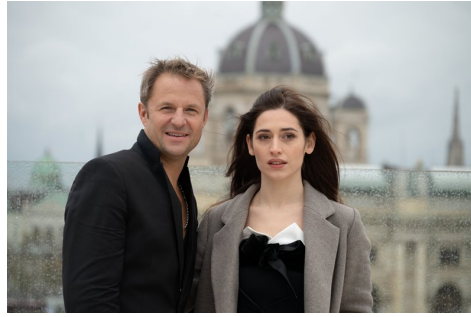
Ph. Hochmair u. D. Piasko