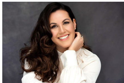
Lombardi © Charles Mares