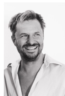
Ph. Hochmair