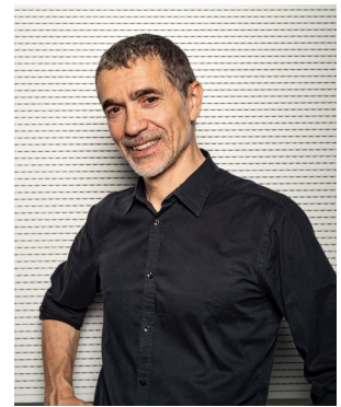
Romeo Castlucci