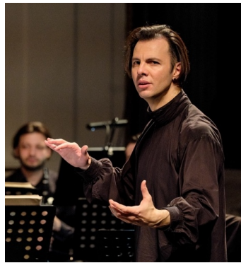
Teodor Currentzis