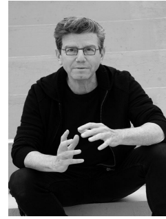
R.Carsen © t.de pera scaled