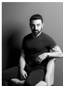
Luciando © armand sallabanda