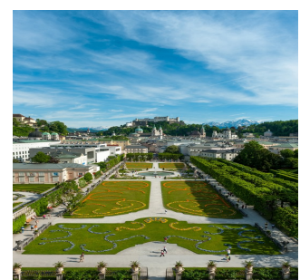
Mirabell Park